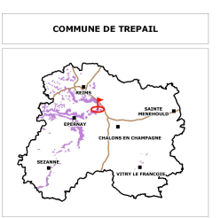
ANNEXE n°1 : Plan indiquant le périmètre des terrains intéressés

REPERE LOCAL FRANCISCAZE Date 20/08/2020 www.marnet.chambagri.fr